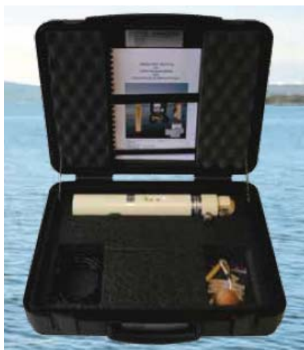
SD204 в кейсе для транспортировки и хранения