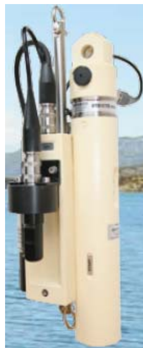
Зонд SD204 с опционными датчиками